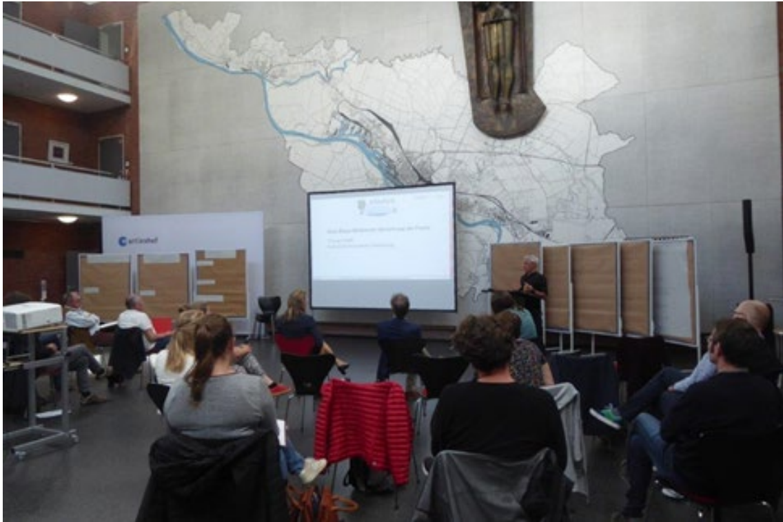
Abb. 1: Teilnehmende des Kooperationsforums klimaangepasste Parkgewässer am 13.06.2022.